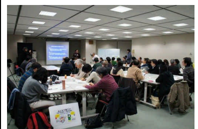
パブコメセミナーの様子