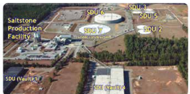
米国サバンナリバー核施設での汚染水モルタル固化の様子（「SRS Liquid Waste Planning Process Rev.21 (Jan.2019)」より）

なお、11月17日（日）には、福島県いわき市にて、『公開シンポジウム：どうなっているの？ ALPS処理汚染水「海洋放出が唯一の選択肢」は本当か？』（ http://www.ccnejapan.com/?p=10560 ）これ以上海を汚さないで！市民会議、国際環境NGO FoE Japanとの共催）が開催されます。詳細は原子力市民委員会のWEBサイトをご覧ください。