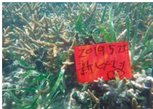
新たに発見されたヒメマツミドリイシ群落

(2) 「出芽・生育期間海水温の平年差とクビレミドロ生育面積の変化」(H11年～H30年)を見ると、H28年5月～H29年4月は平年差は+1.0で、面積減少率は-46%であり、H30年5月～H31年4月の平年差は+0.8と小さいのに減少率は高く、-61%である。平年差（水温の高さ）とクビレミドロ面積との相関関係は明確ではない。