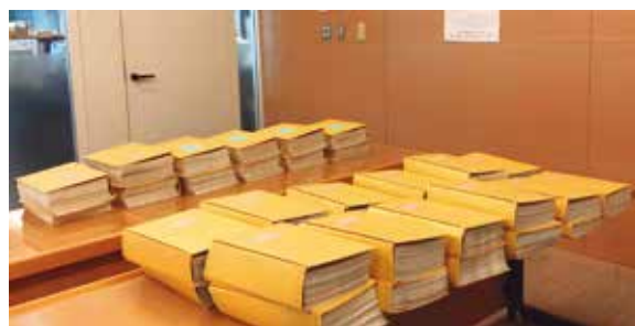
低線量詳細モニタリング事業成果品「Cエリア除染調査回答」「対応票」など25000枚。原発事故後3年目に行われたアンケートには、避難もできず、除染もされず、ずっと声も出せなかった不安や思いが綴られているものも含まれている。2018年9月11日伊達市役所内で閲覧した時の様子

これらの活動により、論文検証を進展させ、伊達市の除染関連データを今年度の後半に入手するための準備を整えました。また、その存在やその問題性を知らされていない当事者（住民）に周知しました。