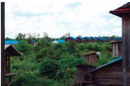
新・クパール・ロミア村にて