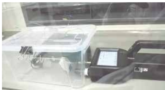
家庭用品から放散される微小粒子状物質の測定の様子

気中パーティクルカウンターを設置した閉鎖環境を作成し、柔軟剤や洗剤を適用した布から放散される粒子数と、対照の布から放散される粒子数を比較する調査を行っています。また、顕微鏡画像を撮影し、家庭用品から放散され平面に落下した粒子数を計測する手法を検討しています。