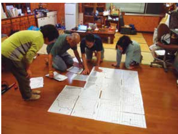
地図を前にした打ち合わせの様子

昨年末、環境省による常磐自動車道拡幅工事のために、除染土を再利用する計画が浮上しました。2019年春から、地域住民の皆さんの協力を得て、該当場所である南相馬市小高区西側の測定を開始、320ポイントで土壌採取を行いました。土壌汚染密度の平均は 475,000 \text{ Bq/m}^2 でした。