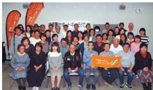
中皮腫サポートキャラバン隊・静岡講演会&患者交流会（2019年4月6日）