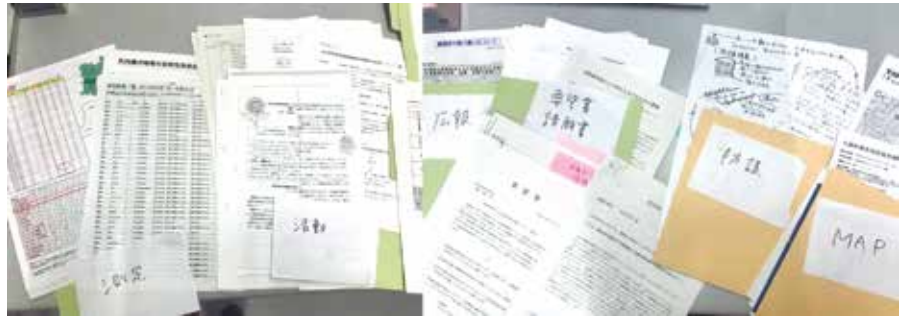
「記録集」の目次作成のため、これまで収集してきた資料を項目ごとに仕分けしている

また震災後8年半を得て、時間の経過とともに、住民が直面する課題も複合的に推移してきています。震災当初は初期被ばくへの不安をはじめ、子どもたちの生活環境を中心とした空間線量の測定やホットスポットの除染といった放射線防護措置の要求、食品やホットパーティクルなどによる内部被ばくへの懸念などが中心でした。その後、福島での県民健康調査結果に伴う健康不安と健康調査の要望、2018年から県内で始まった8000Bq/kg以下の放射性廃棄物の焼却をめぐる問題へと、重層的に推移しています。さらには、今後の女川原発における廃炉作業に伴う問題、また再稼働をめぐる問題など、市民社会内での注意喚起や