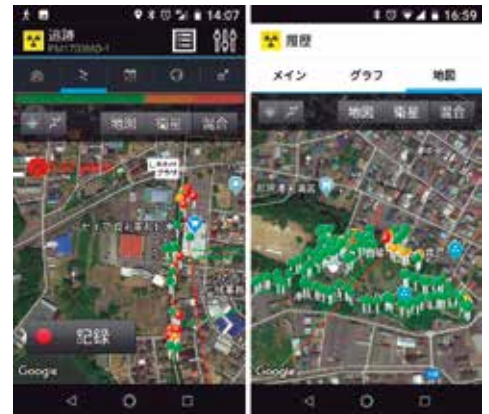
スマホ連動型POLIMASTER PM1703M-1BTによるホットスポット探索の実測例。測定場所は、ひたちなか市神敷台けやき並木（左）と同市那珂湊公園（右）。色分け線量区分：赤0.5 \mu Sv/h以上、橙0.23～0.5 \mu Sv/h、緑0.23 \mu Sv/h以下

各地域の担当スタッフが測定を続けているほか、5月には県南地区（牛久市及び阿見町）、9月には鹿行地区（神栖市及び潮来市）にて、本プロジェクトのスタッフで共同測定を行いました。6月には県央エリア（ひたちなか市・水戸市など）の放射線量率の測定してきた「こつこつ測り隊」のメンバーと国営ひたち海浜公園で共同測定を行いました。また、9月には東海村及び大洗町においてCs-137及びSr-90測定用の環境試料採取を行いました。