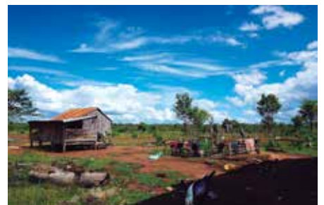
旧・クパール・ロミア村にて