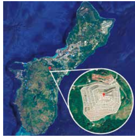
グアム島中部のOrdot廃棄物処分場、現在の様子。

2018年10月、米地裁は連邦政府に対して、グアム政府が負担した基地跡地の浄化費用のうち、1億6000万ドルの支払いを命じます。グアム政府が2004年の段階で、浄化費用の負担に同意していなかったことがその理由です。