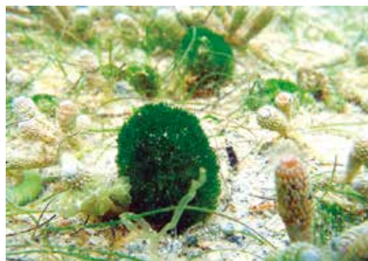
クビレミドロ（黄緑藻類）。絶滅危惧IA類、世界でも泡瀬干潟など沖縄でのみ確認されている