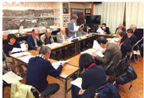
「ビキニ検証会in高知」の様子（2019年4月14日）

一方、厚労省社会保険審査会の労災申請の再審査結果やビキニ核被災国家賠償請求訴訟第二審判決の動向を見ながら、仮称「核実験被災船員救済特別措置法」の立法化をめざして、高知県はじめ、関係者への呼びかけを広げていきます。また弁護士を通じて、国連人権委員会への意見書提出等も検討していきます。