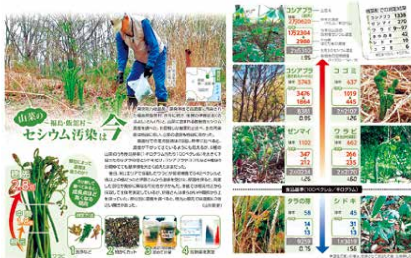
2019年6月5日に掲載された東京新聞の記事「福島・飯館村 山菜のセシウム汚染は今 (2019年)」。 10月16日には「食用キノコ セシウム汚染は今～福島・飯館村～」が掲載されている