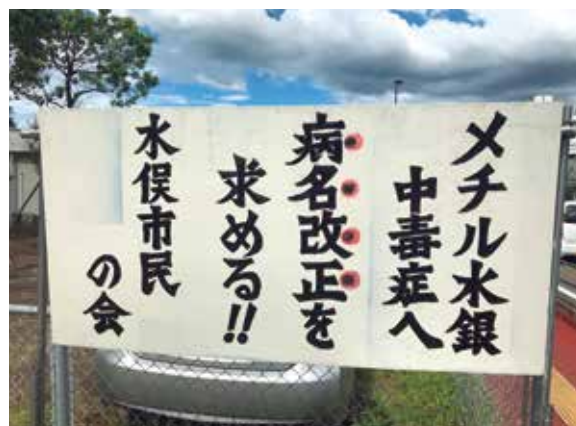
水俣病の原因企業チッソの事業子会社JNC水俣製造所の正門近くの私有地に立てられた看板

今年度は、引き続き11月/12月/1月/3月に現地調査を予定しています。また1月には、水俣病事件研究交流集会での研究成果の発表も予定しています。加えて、調査の成果を聞き書き集（「水俣病を語り継ぐ会」のブックレットを検討中）として編集・刊行することを予定しています。