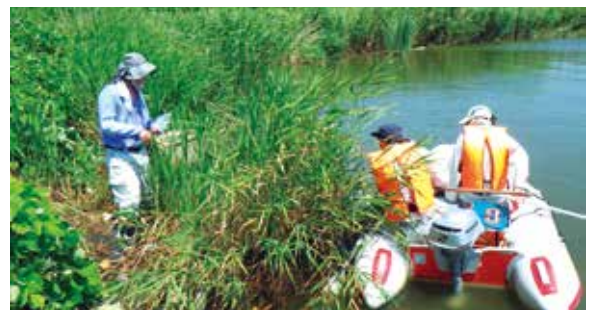
湖岸での水質及び生物調査(2019年8月3日)